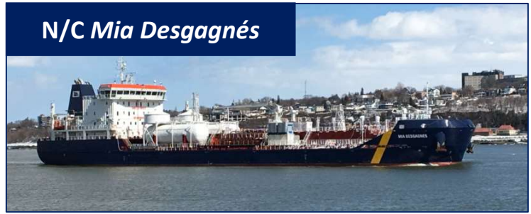
N/C Mia Desgagnés

21, rue du Marché-Champlain Québec (Québec) G1K 8Z8 Canada Tél. : 418.692.1000 Télec. : 418.692.6044 Courriel : info@desgagnés.com Site Web : www.desgagnés.com